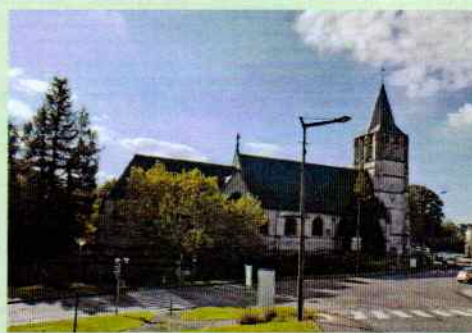
Eglise saint Martin de Canteleu